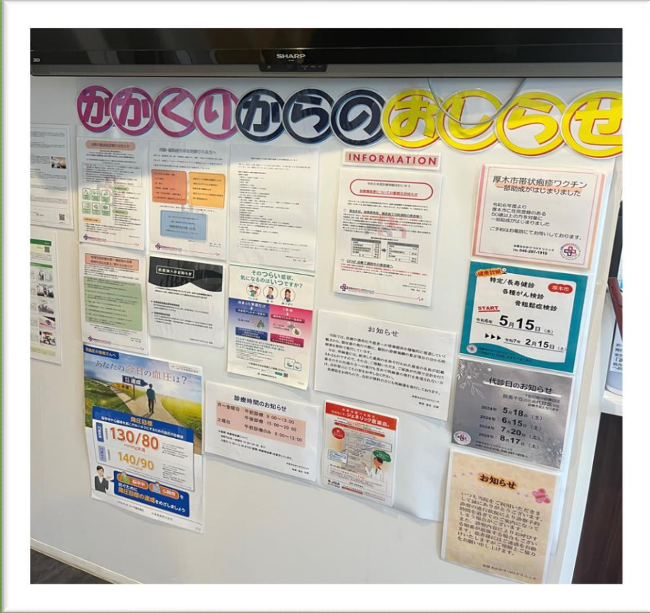
今までいろいろな所に貼っていたものを一か所にまとめ患者様になるべく目を通していただけるようにした