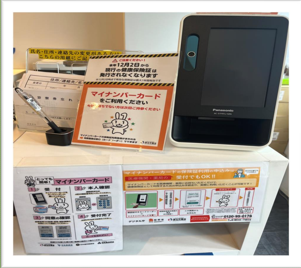
医療DX推進のため積極的にマイナンバーでの受付をしていただくようアピール